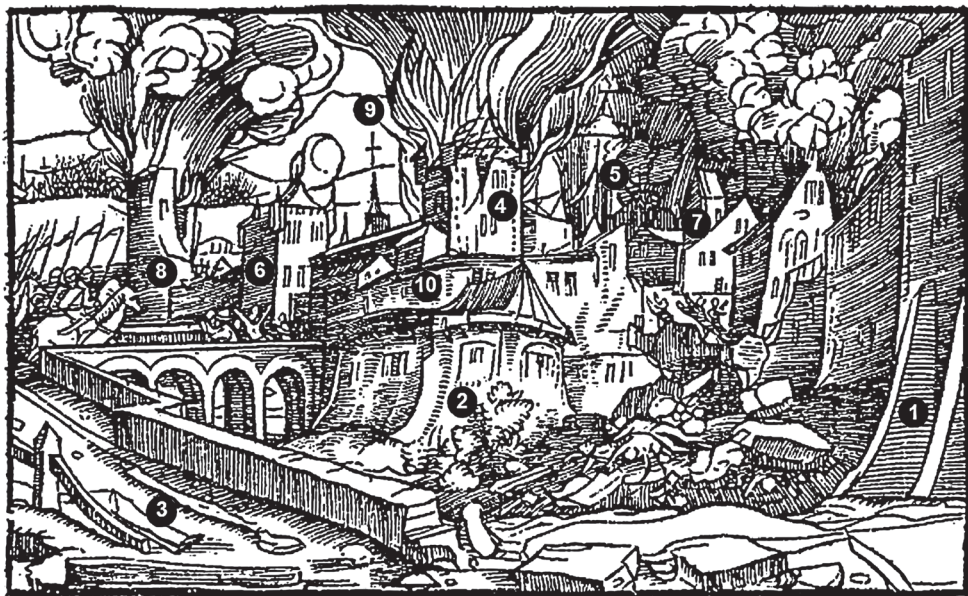
OBR. 3. Dřevořezná knižní ilustrace ze Steynerova překladu Hájkova textu k roku 1541 s navrhovaným ztotožněním zobrazených staveb s reálnými objekty v areálu Pražského hradu. Stranově obráceno. Čís-la odpovídají objektům popsaným v textu. 1 — Ludvíkovo křídlo, 2 — bašta jagellonského opevnění, 3 — komunikace z malostranského podhradí, 4 — Bílá věž, 5 — jižní věž katedrály sv. Víta, 6 — věž při západní linii románské hradby, 7 — věž mezi Bílou věží a jižní věží románské hradby, 8 — věž při severním vyústění druhého příkopu Přemysla Otakara II., 9 — věžička neznámé (sakrační?) stavby, 10 — zdivo románského bastionu.

směřuje z předního plánu komunikace, lemovaná ze severní strany zdí (obr. 3: 3). Existence takové komunikace — se zděným ohrazením a rámcově shodným průběhem — je historickými prameny doložena, i když její konkrétní podoba včetně ji provázejícího ohrazení je na historických vyobrazeních poněkud odlišná. Komentář k umístění mostu a k jeho vzhledu zachycenému vedutou je jedním z nejspornějších míst předkládané hypotézy. Zaslouží si proto detailnější rozbor; zatím se omezme na obecné konstatování, že poloha mostní konstrukce, směřující k bráně při Bílé věži (obr. 3: 4), jen rámcově odpovídá přemostění, zachycenému na dalších vedutách. Pokud jde o stavby, které autoři na vedutě postrádají (viz citace výše), v našem pohledu by se Vladislavský sál nacházel mimo zorné pole pozorovatele, Ludvíkovo křídlo na vedutě máme, chybí tedy katedrála sv. Víta. Místo, kde by se měla nacházet, se ovšem zcela ztrácí v dýmu, s výjimkou věže, která, ač je v zadním plánu, převyšuje krov Bílé věže. Tvar zastřešení pod špičkou věže patrný na vedutě připomíná věž katedrály poměrně nápadně (obr. 3: 5). Veduta dále zachycuje tři hradební věže, pro které rovněž nacházíme jejich reálné předlohy. Pozice věže za mostem jednoznačně odpovídá