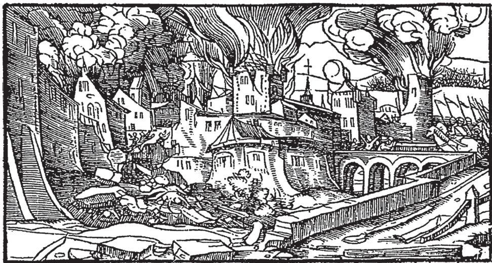
OBR. 1. Dřevořezná knižní ilustrace ze Steynerova překladu Hájkového textu k roku 1541. Převzato z: Jan KOZÁK — Petr CHOTĚBOR, Ilustrace k soudobé zprávě o požáru Pražského hradu roku 1541 , Průzkumy památek 8/1, 2001, s. 146.

se však nabízí i další možnost interpretace tohoto cenného vyobrazení. Nedá se totiž bezvýhradně souhlasit s výchozí tezí, že na vedutě „nejsou rozpoznatelné notoricky známé hradní dominanty viděné na standardních historických grafických pohledech na Pražský hrad od jihu, jakou je hlavní věž Svatovítského chrámu, východní část lodi katedrály či Vladislavský sál a Ludvíkovo křídlo“. 5 Naopak, z hlediska archeologa detailně obeznámeného s terénní situací Pražského hradu, dnes překrytou mnohými historickými přestavbami, lze zobrazení veduty v řadě aspektů snadněji ztotožnit s členitou jižní partií Pražského hradu než se situací nad svahem Jeleního příkopu a potokem Brusnicí.